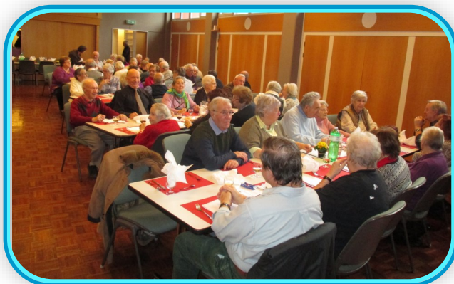
brin de causerie avant le repas