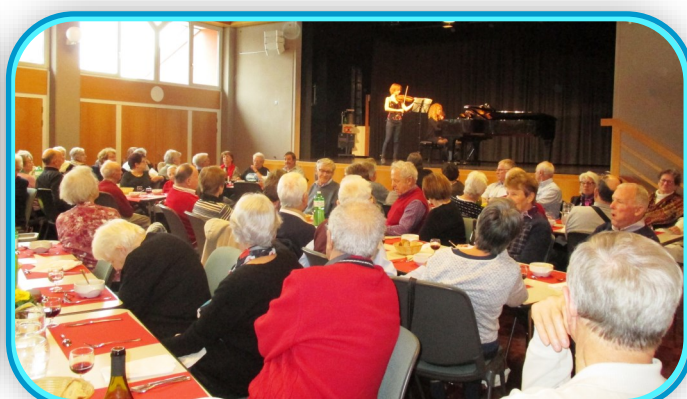
charmés par nos jeunes virtuoses