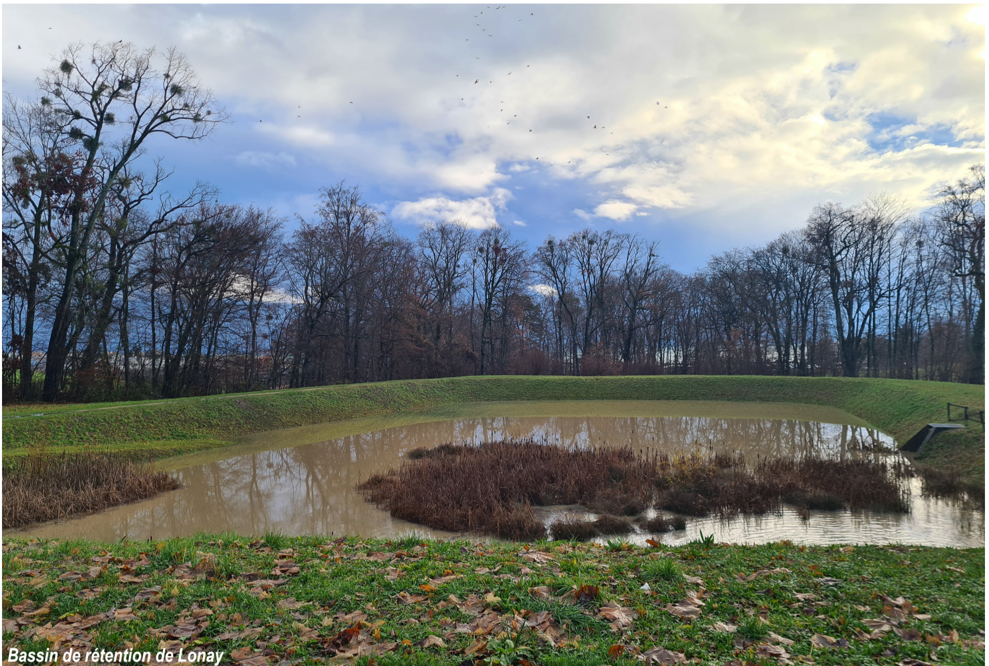
Bassin de rétention de Lonay