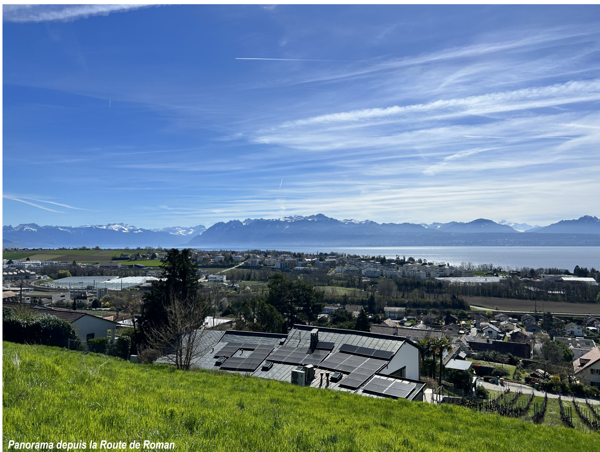
Panorama depuis la Route de Roman