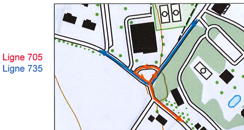
Figure 1 : Situation générale du projet

La zone en question se situe devant la salle omnisports, à l'endroit actuel de l'arrêt de bus « Lonay, Parc ».