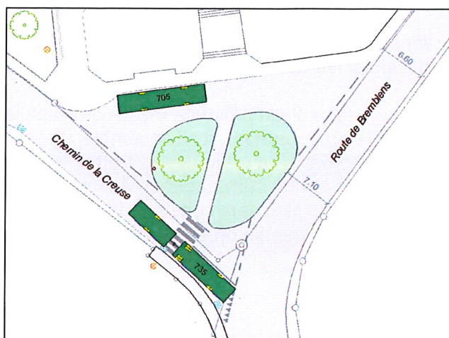
Figure 2 : Situation initiale

De plus, depuis l'introduction des bus articulés sur la ligne 735, il ne leur est pas possible de faire le tour de l'îlot central.