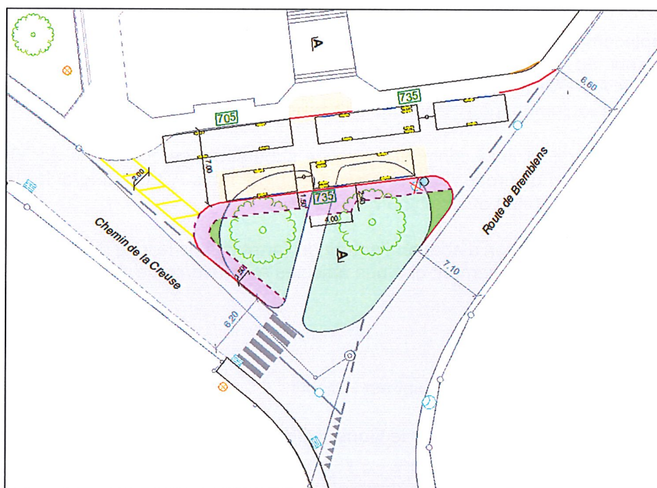
Figure 3 : Plan de situation du projet

Le projet propose d'élargir la zone des arrêts de bus de 2 m, passant ainsi à 7 m, comme l'illustre la Figure 3. Cette configuration permettra aux deux lignes de bus de pouvoir se croiser, lorsque le bus 735 roule en direction de Cossonay, respectivement de dépasser lorsqu'il roule en direction de Morges. En outre, cela permettra d'offrir un quai d'embarquement à la ligne 735 dans le sens Morges-Cossonay.